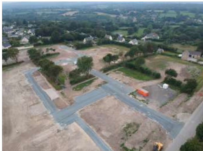
Photo du chantier mi-août