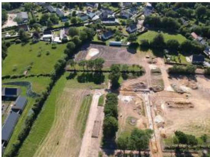
Photo du chantier mi-juin

Les travaux de la 1ère tranche devaient initialement débuter le 20 mars 2020. Le confinement lié à la Covid-19, décrété le 16 mars, nous a conduits à différer leur commencement.