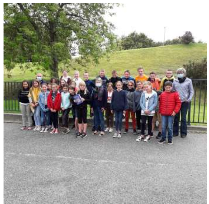
Remise des dictionnaires

La municipalité s'est engagée dans un projet de compostage et de valorisation des déchets de la cantine, impliquant les enseignants et les enfants.