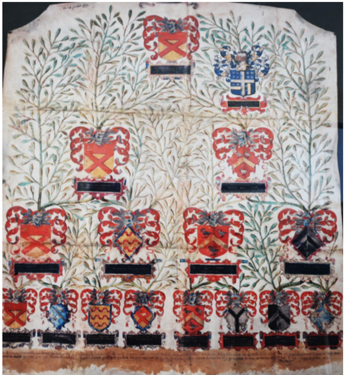
Don de M. Alain Pithois : arbre généalogique de la famille BRUCE