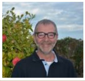
Mesdames, Messieurs, Chers Concitoyens

Cette fin d'année 2018 arrive très vite, trop vite et me fait penser à la grande pression qu'exerce sur nous le temps qui passe car il est vrai qu'un mandat de maire est un monstre assoiffé de temps : celui qu'il faut consacrer au fonctionnement des services de sa commune, celui qu'il faut consacrer aux nouvelles institutions, celui qu'il faut consacrer aux projets en cours, celui qu'il faut consacrer à rencontrer chacune et chacun d'entre vous. Pour ce qui me concerne, c'est du temps que j'ai plaisir à prendre.